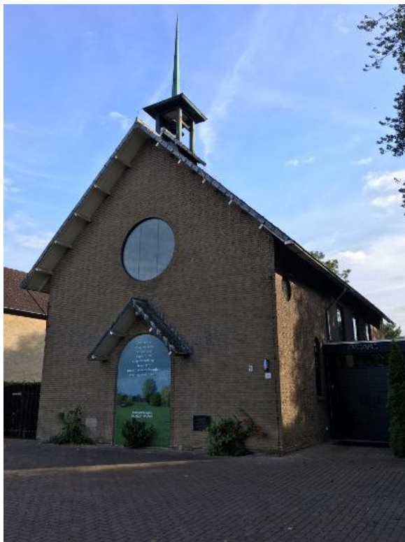
Dit mooie kerkje wacht